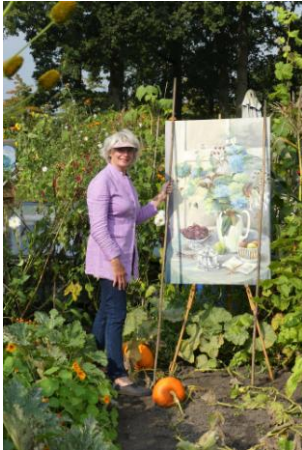
Jetty Liezenberg tuin nr.55 - schilderijen