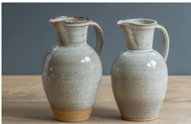
Ron Jacobs tuin nr. 47 - keramiek, kruiken en vazen