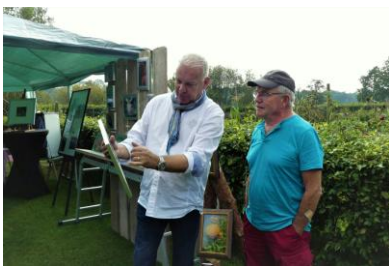
Wim Bronkhorst tuin nr.57b - foto's