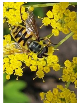
Doodskopzweefvlieg op de bloemen van een venkelplant

En over weer drie jaar waar staan we dan? Dan zal hopelijk duidelijk zijn of we al kunnen beginnen met onze spullen in te pakken of dat we deze prachtige plek zullen behouden en wellicht zelf eigenaar worden. Op dit moment zou ik niet durven voorspellen welke kant het muntje op zal vallen. Ik verwacht dat Eigen Oogst blijft bestaan, maar net zoals met de weersverwachting is er altijd een onzekerheid.